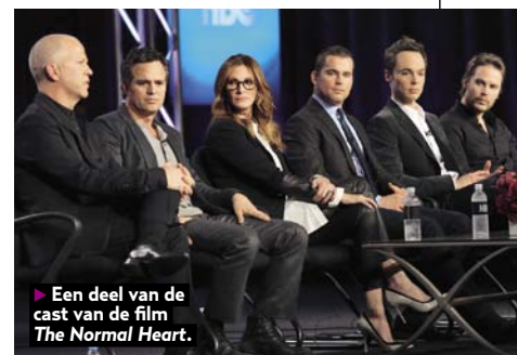
► Een deel van de cast van de film The Normal Heart .

combinatie in dit avonturenspektakel vol slapstick en running gags. Zoals de muffige inspecteur die er maar niet aan toe komt om een maaltijd te beëindigen, omdat hij steeds gewelddadig wordt gestoord. En Louise Bourgoïn speelt een heerlijke hoofdrol. De op een jonge Isabelle Adjani lijkende actrice speelt met overtuiging, panache en een vleugje brutaliteit. Vanaf woensdag op Netflix.