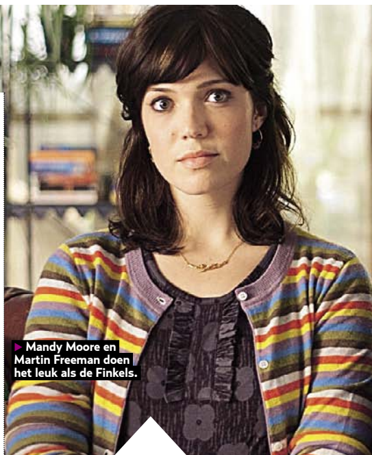
► Mandy Moore en Martin Freeman doen het leuk als de Finkels.

De fantastische avonturen van Isabelle Avondrood is een hilarische reeks stripboeken van Jacques Tardi. Tussen 1976 en 2007 zijn er negen delen verschenen. De mooie Isabelle krijgt in elk album te maken met corruptie, domheid, bureaucratie en een of ander prehistorisch monster. De film vertelt vooral het verhaal Isabelle en het monster , maar gebruikt ook elementen uit De demon van de Eiffeltoren en Maanzieke mummies .