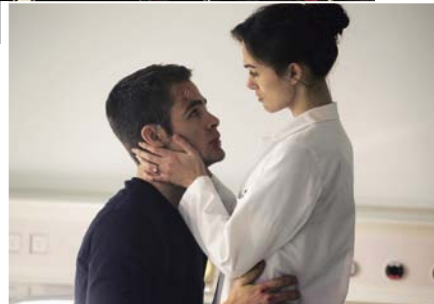
▲ Keira Knightley is al de vierde actrice die Cathy Ryan speelt.

gadgets. En met Chris Pine een jong, fris gezicht. Pine mocht al eerder een legende spelen: James T. Kirk in de eerste twee films van de reboot van Star Trek . Wordt dit een specialiteit van de Amerikaanse acteur?