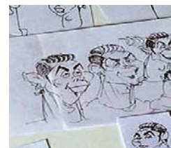
▲ Ribéry was de makkelijkste, Ronaldo de moeilijkste. En zo licht Mars Gremmen het scheppingsproces van de poster nog wat verder toe.

WK-WEETJE Voetbal is oorlog. Rinus Michels zei het in 1969. In 1970 brak er echt een oorlog uit van vier dagen toen Honduras de WK-plaatsingswedstrijd van El Salvador verloor.