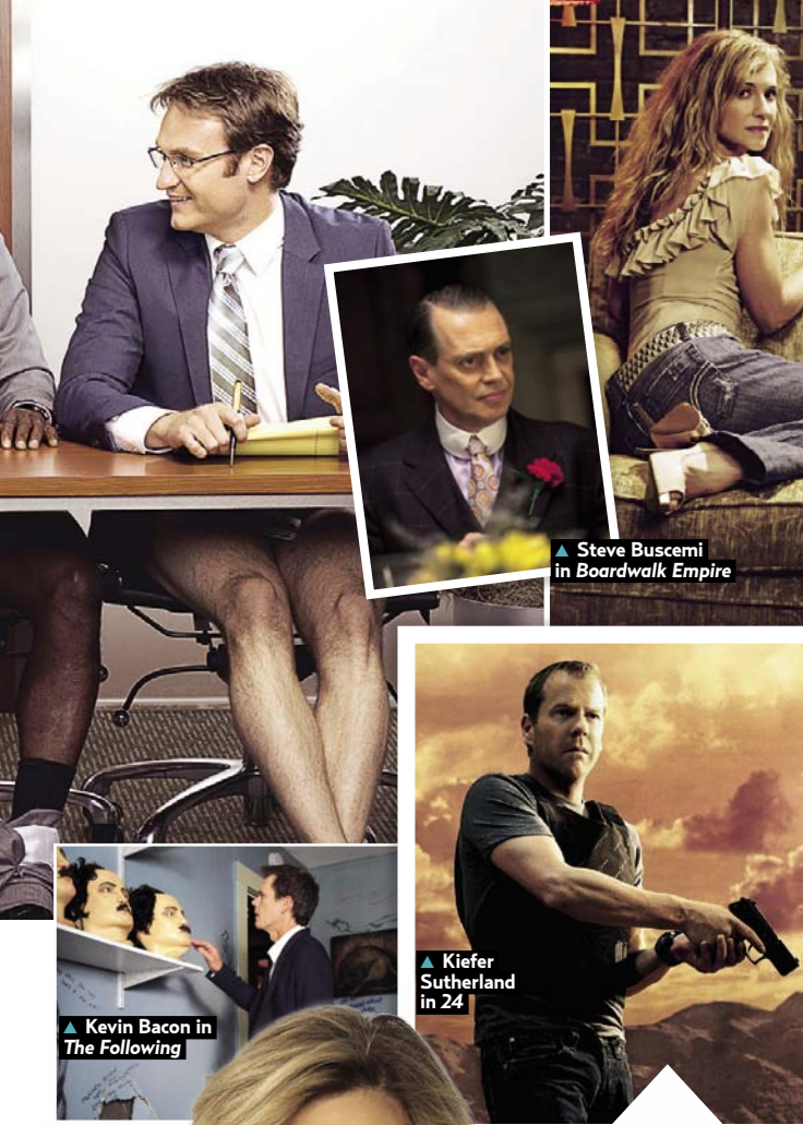
◀ Holly Hunter in Saving Grace