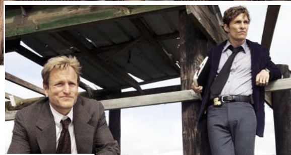
▲ Woody Harrelson en Matthew McConaughey in True Detective