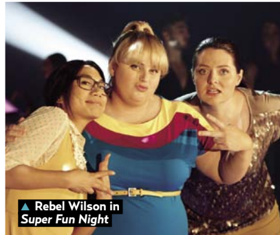
▲ Rebel Wilson in Super Fun Night

Controversiële onderwerpen worden niet geschuwd in series