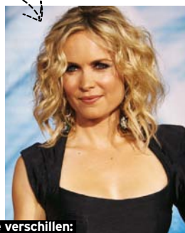
▲ Zoek de verschillen: van Monica Hendrickx naar Radha Mitchell...