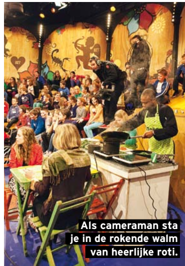
Als cameraman sta je in de rokende walm van heerlijke roti.