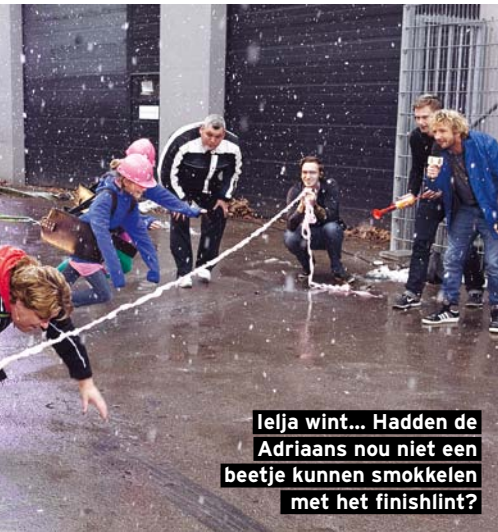
Ielja wint... Hadden de Adriaans nou niet een beetje kunnen smokkelen met het finishlint?