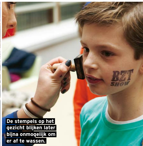
De stempels op het gezicht blijken later bijna onmogelijk om er af te wassen.