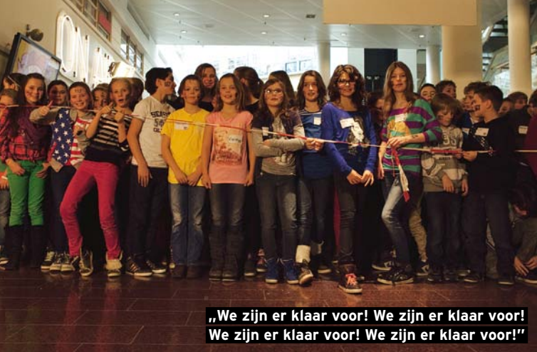
„We zijn er klaar voor! We zijn er klaar voor! We zijn er klaar voor! We zijn er klaar voor!”