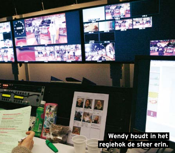
Wendy houdt in het regiehoek de sfeer erin.