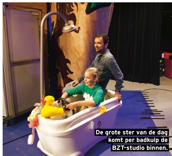
De grote ster van de dag komt per badkuip de BZT-studio binnen.