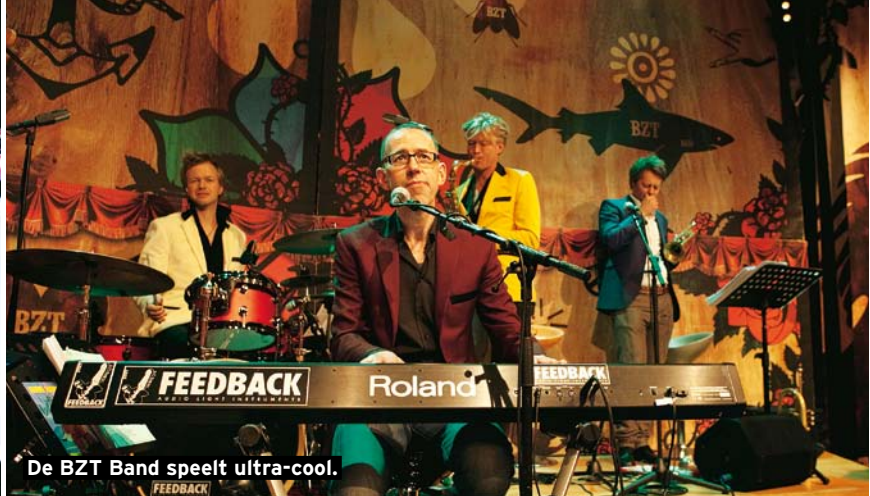
De BZT Band speelt ultra-cool.